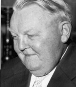
Ludwig Erhard 1966–1967