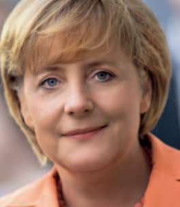
Dr. Angela Merkel