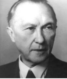
Konrad Adenauer 1950–1966