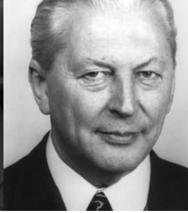
Kurt Georg Kiesinger 1967–1971